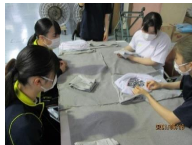
<インターンシップ 6/15~17 ビジネスコース 丸岡消防署 機械コース 八木熊 生活デザインコース 豊島繊維>