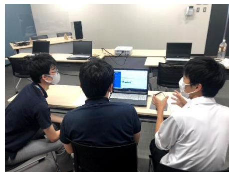
市役所での披露の様子