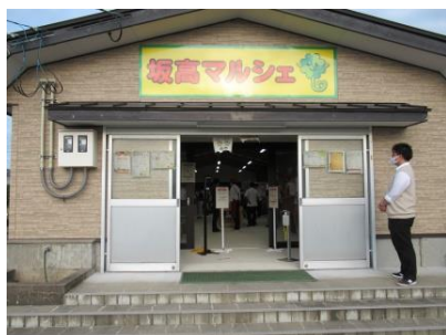
坂高マルシェ外観

た。当日は多くのお客様が訪れ、開始1時間程度でほぼ完売でした。生産・加工から販売・経理まで、お客様のもとへ生産物をお届けすることを体験できる実りある学習の機会となりました。