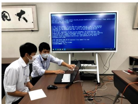
チャットアプリシステム導入風景