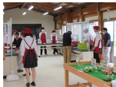
レジ操作による販売実習