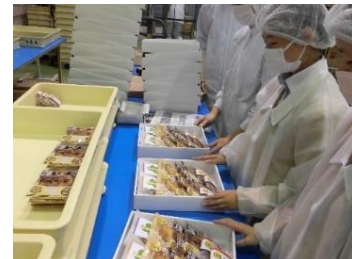
梱包作業もさせていただきました