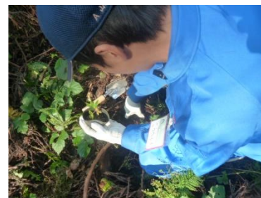
苗の定植。自生地の近くまで行き、 思いを込めて植えてきました