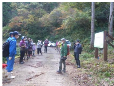
ちくちくぼんぼんの学校林 地元の保全団体の方たちと