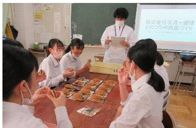
芋入りどら焼を試食中

農業コースが栽培した 安納芋を使った菓子を 企画し、(株)五月ヶ瀬が 製造した和洋菓子を ネットショップで販売し ました。