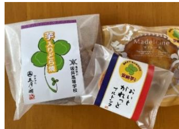
完成した「よつばのおくりもの」