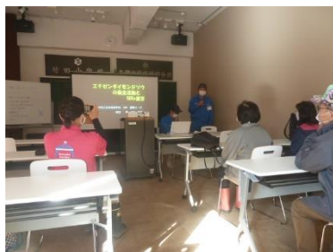
坂井市竹田農山村交流センター 「ちくちくぼんぼん」で研究発表

絶命危惧IA類のエチゼンダイヤモンドジソウを守るため、地域の力を借り、増殖の方法を研究し、定植しました。