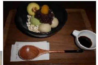
焼き印されたお菓子を使ったデザートです