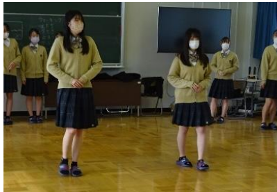
プロの講師からウォーキングの指導を受けました

3年間で身につけた被服に関する知識と技術を活かし、ドレスや浴衣を製作して発表しています。ショーの構成、音楽、舞台装飾も生徒たちで企画します。