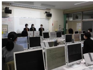
先生役3人、サポート役6人に分担しました

ビジネスコースでは定期的に地域の方へパソコン教室を開催しています。今回はこれから利用の需要が高まるZoomの使い方を知っていただく講座を、旧坂井町コミュニティセンターの主事6人の方を対象に開催しました。