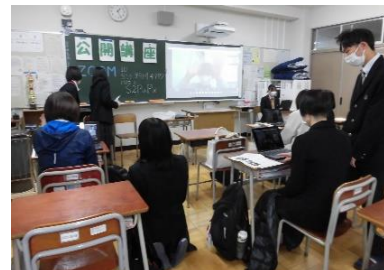
参加者に対してマンツーマンで対応しました