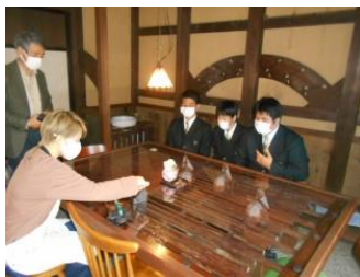
甘味処「てまり」で打ち合わせをしました

過去2回の焼きごて寄贈が新聞・テレビ等で取り上げられたことで、NPO法人今庄旅籠塾より製作依頼をいただきました。