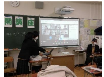
Zoomの主催者・参加者の両方の体験をしていただきました