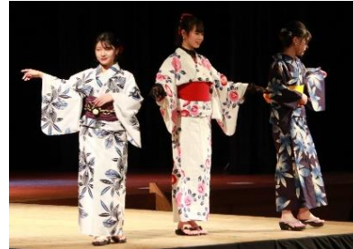
2年生で製作した浴衣と3年生で製作したドレスを披露しました