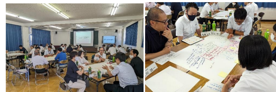
【コンソーシアム キックオフ研修会の様子】

8/29(火)に、坂井高校コンソーシアム設立のための運営委員会兼キックオフ研修会を行いました。「学校と企業の協働によって実現したい未来の姿」、「コンソーシアムでやりたいこと」をテーマに、坂井高校の教員、大学の教授、企業の方々など、様々な視点から話し合い、コンソーシアムに関して相互理解を深めました。