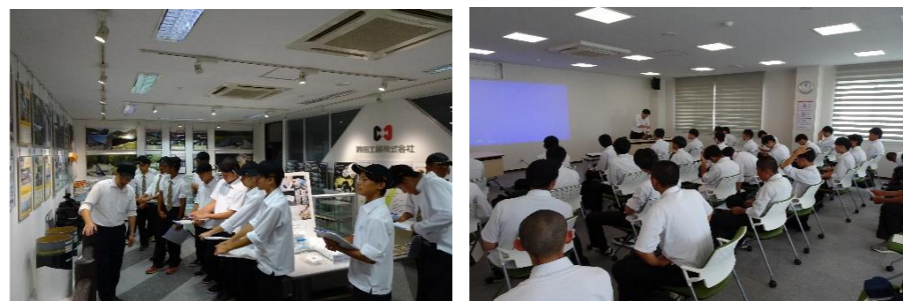
【前田工織株式会社 講義中の様子】

・福井県にこんなすごい工場があり、嬉しく思った。 ・見学して、働くことの大切さや楽しさを知った。将来の幅が広がった。