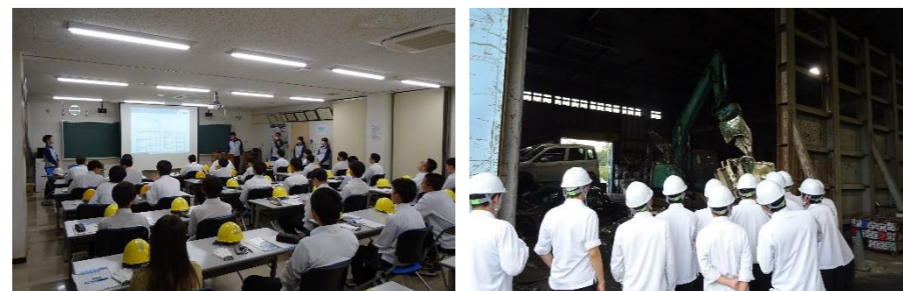
【株式会社 UACJ 福井製造所】