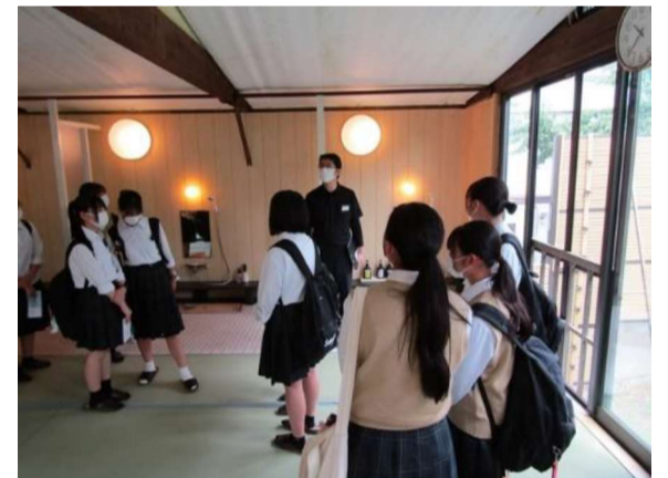
三国観光ホテル見学