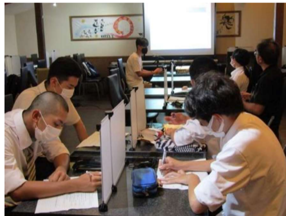
東尋坊再整備についてのお話