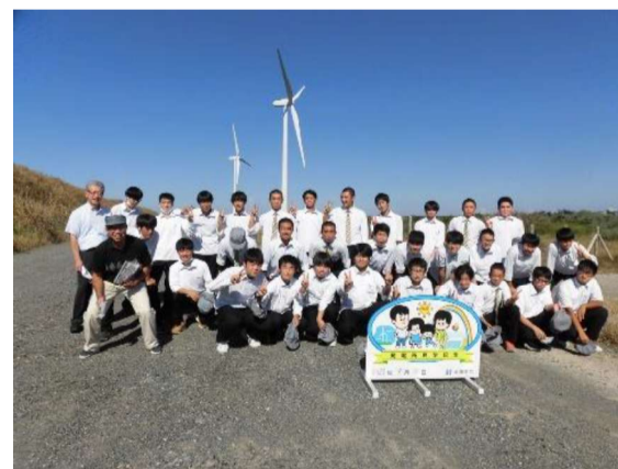
北陸電力 風車の前で記念撮影