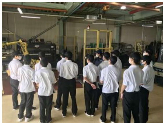
全自動ロボットの見学