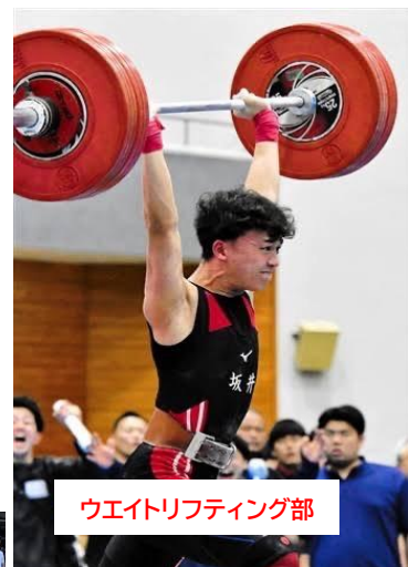
ウエイトリフティング部