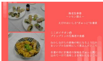
Lコース Sea 級グルメ全国大会にむけて

地元企業に本校産の安納芋を使った菓子ギフトセット開発を提案して、ECサイトを使った予約販売実習を行いました。