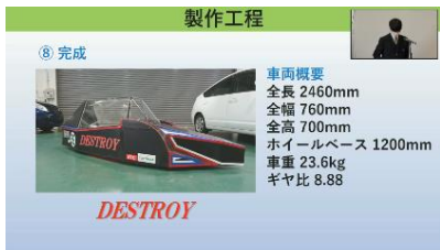
Vコース エコデンカー ～DESTROY～

毎年大阪でエコデンレースという大会が開催されています。ミニバイク用のバッテリーを使用し、定められた時間内の走行距離を競う大会です。今年で開催27回目になりますが、本大会が最後の開催となります。有終の美を飾るべく、DESTROYと名付けた車両を製作し、レースに挑みました。