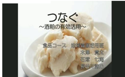
Fコース つなぐ ～酒粕の有効活用～

絶滅危惧種であるアゼオトギリとエチゼンダイモンジソウを地域の団体などと連携し坂井地区の絶滅危惧種を保全しようと考えました。その保全方法をほかの絶滅危惧種にも応用し、さまざまな絶滅危惧種を保全していくことを考えています。この活動がSDGsにつながっていくことがわかり、SDGs宣言をしました。