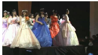
Lコース 卒業制作発表会 ファッションショー

「みなとオアシス全国大会」の一環として、グルメイベント「Sea 級グルメ全国大会」が開催されています。坂井市から大会出場に向けてレシピ開発等の連携活動ができないかという要望を受け、課題研究で取り組んだ内容を紹介しています。