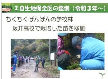
Aコース 地域の絶滅危惧種 保全活動でSDGs宣言

今までは各コースそれぞれでの発表会でしたが、この日は学校全体での発表となり各コースの代表チームが発表しました。環境問題からもの作りに関すること、オンラインショップの開設など多岐にわたる研究の成果を発表しました。