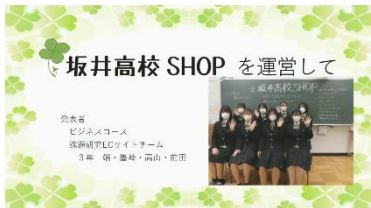
Bコース 坂井高校 SHOP を運営し

今年度は坂井市役所職員の意思疎通や情報共有を円滑に行えるようにしたいという要望に応え、チャットアプリを導入しました。企業連携を通しての成長や専門知識の向上により、新たに坂井高校用に開発した求人票閲覧システムの紹介もしました。