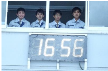
Eコース 第2グラウンド用 大型電波時計の製作と設置

毎年大阪でエコデンレースという大会が開催されています。ミニバイク用のバッテリーを使用し、定められた時間内の走行距離を競う大会です。今年で開催27回目になりますが、本大会が最後の開催となります。有終の美を飾るべく、DESTROYと名付けた車両を製作し、レースに挑みました。